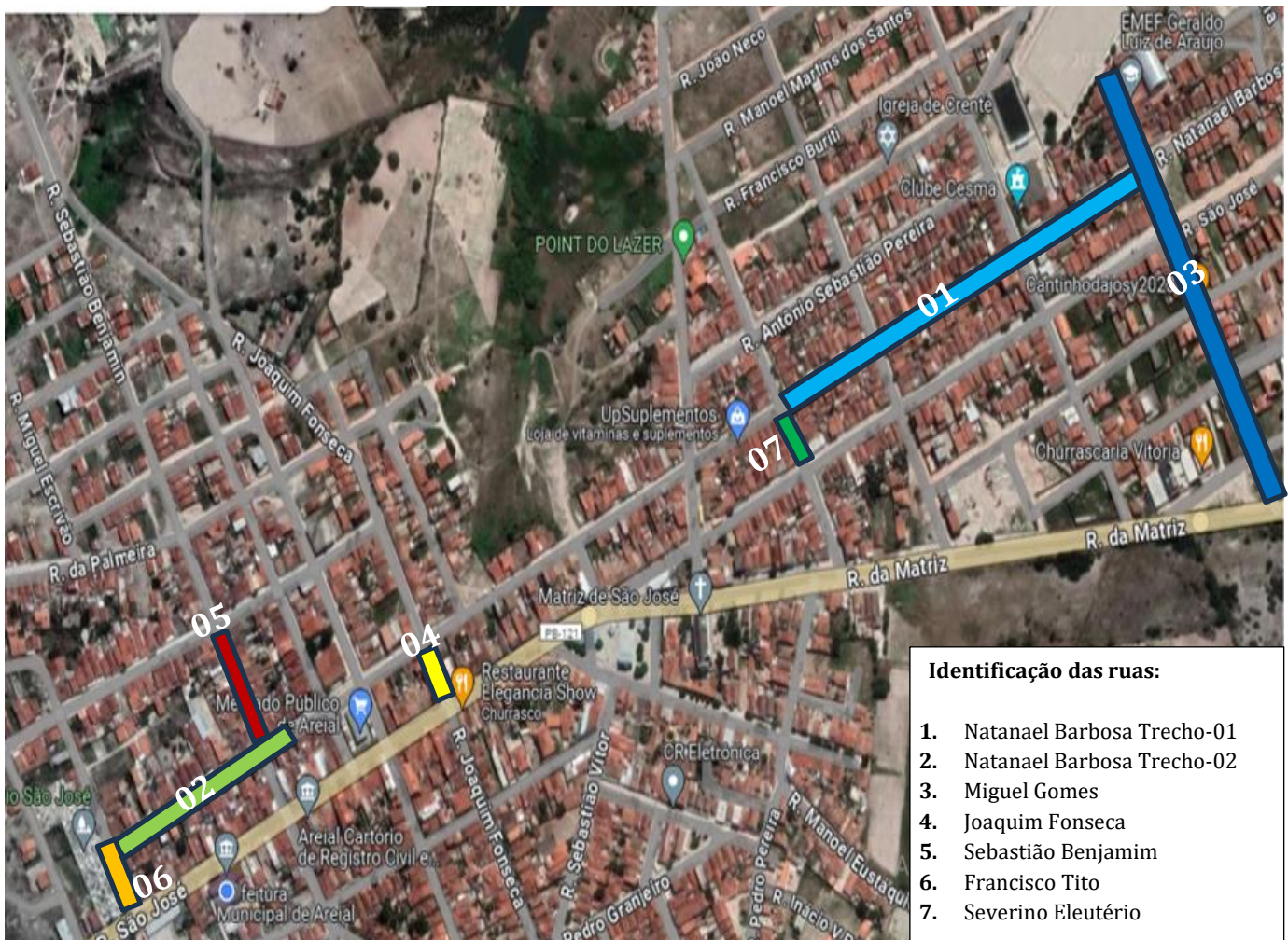
Figura 01: Mapa de localização

Rua SEVERINO ELEUTÉRIO: A Rua Severino Eleutério será executada entre os cruzamentos com a rua Natanael Barbosa e cruzamento com a rua São José recebendo Capeamento Asfáltico sobre a pavimentação em paralelepípedos existentes.